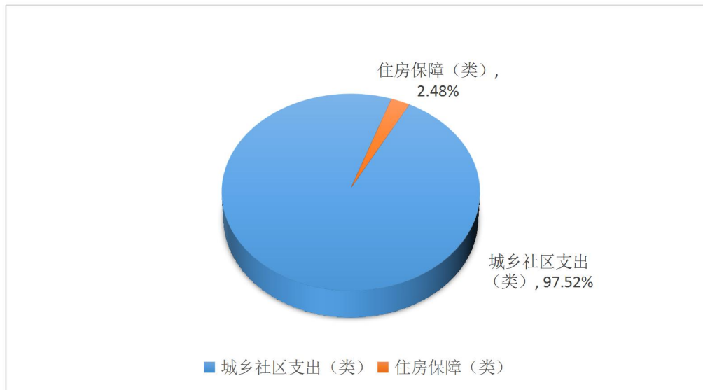
支出决算结构情况（图 3）

2020 年度财政拨款支出 1409.15 万元，主要用于以下方面城乡社区支出（类）1374.19 万元，占 97.52%，住房保障（类）支出 34.96 万元，占 2.48%。