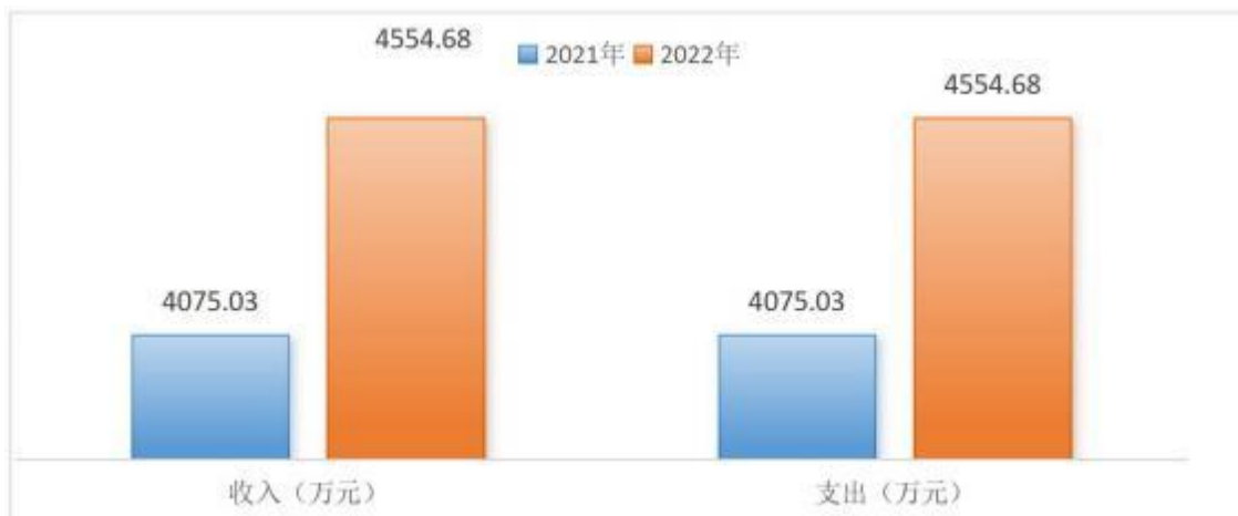
2021 年与 2022 年收支总计对比情况

本单位 2022 年度收、支总计（含结转和结余）4554.68 万元。与2021 年度决算相比，收支各增加479.65 万元，增长 11.77%，主要原因是县政府批复项目增加。